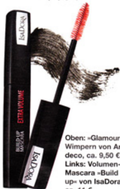
Oben: »Glamour«-Wimpern von Artdeco, ca. 9,50 €. Links: Volumen-Mascara »Build up« von IsaDora, ca. 11 €